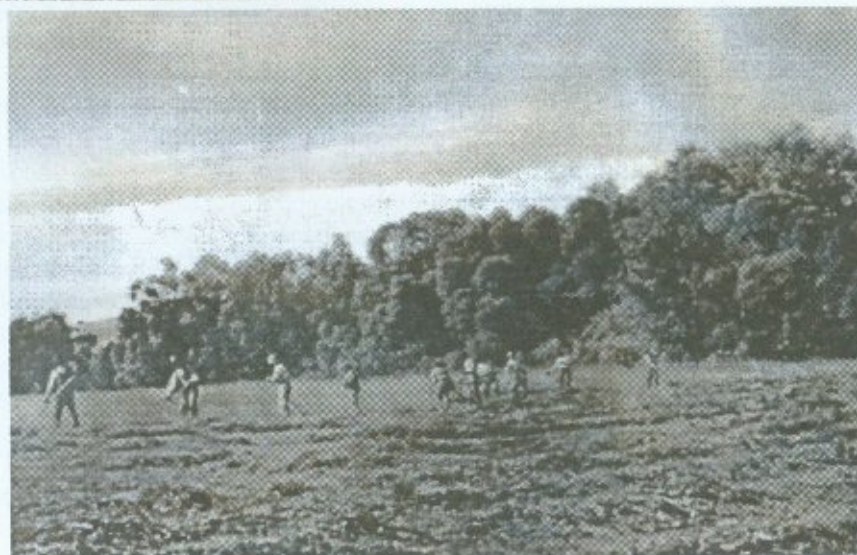
Лабова (Зах. Лемківщина) перед 1939 р. Косять луку (На Попівщині ?)