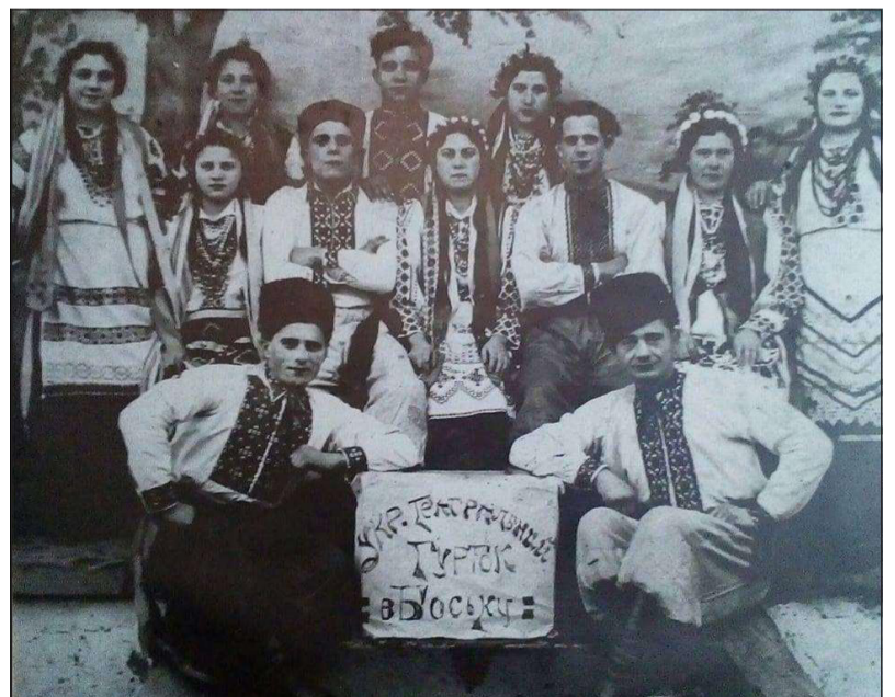
Український драматичний гурток в с. Босько, п-т Сянік на Лемківщині. 1930-и рр.

Лемку! Маш бесьїдувати, гварити, мовити, повідати, радити, речы, гадати. Втовды лем будеш собом і шанувати Тя будут Люде.