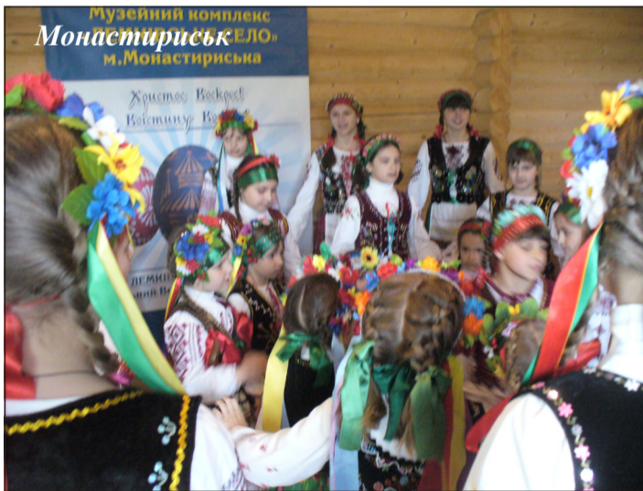
Музейний комплекс Монастирське село, м. Монастириська