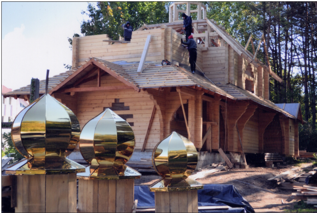
Будова Лемківської церкви в Тернополі. Вересень 2014 р.