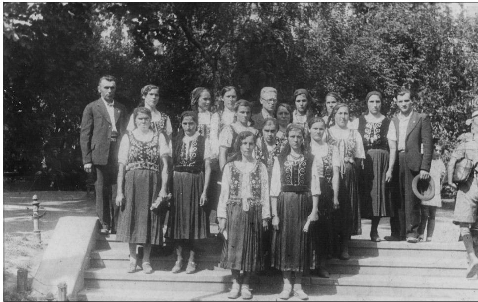
Лемківській хор с. Устя Руске, п-т Горлиць. 1937 р.