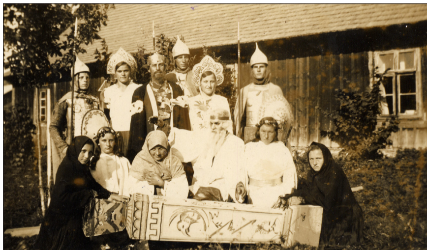
Пам'ятка з представління «Сумерки поганьства на Руси». 1939 р.