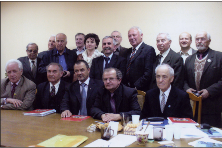
Засідання Президії СФУЛО. Горлиці, Польща. 7.05.2011 р.