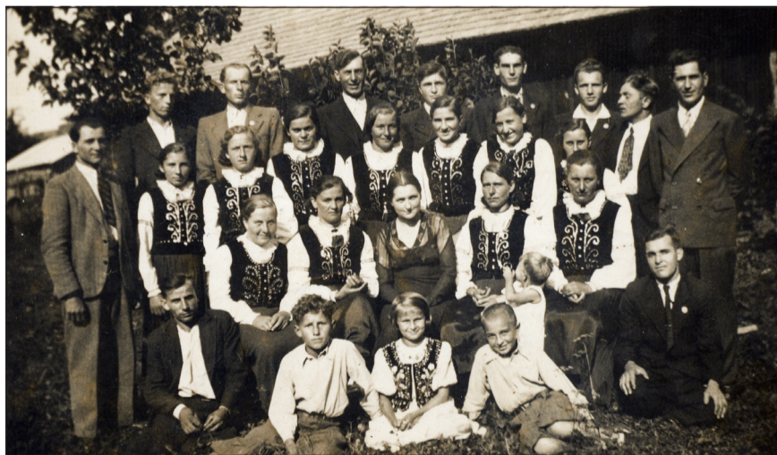
Хор з Устья-Руского, п-т Горлиці. 14 сєрня 1938 р.

Лемку! Маш бесьїдувати, гварити, мовити, повідати, радити, речы, гадати. Втовды лем будеш собом і шанувати Тя будут Люде.