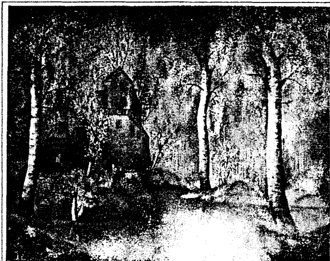
Ваньо Лабовскій. Замок. 1979р Окружний Музей в Гожові Влкп.

Поміщены репродукції малюнків Ваня Лабовского взяты з періодька Polska Sztuka Ludowa, 1985-3/4. Не посідаме репродукцій різб Штефана Габуры, за што - перепрашае. (Ред.)